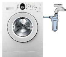
NA PRALNIH STROJIH