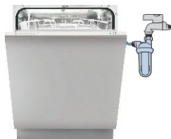
NA POMIVALNIH STROJIH